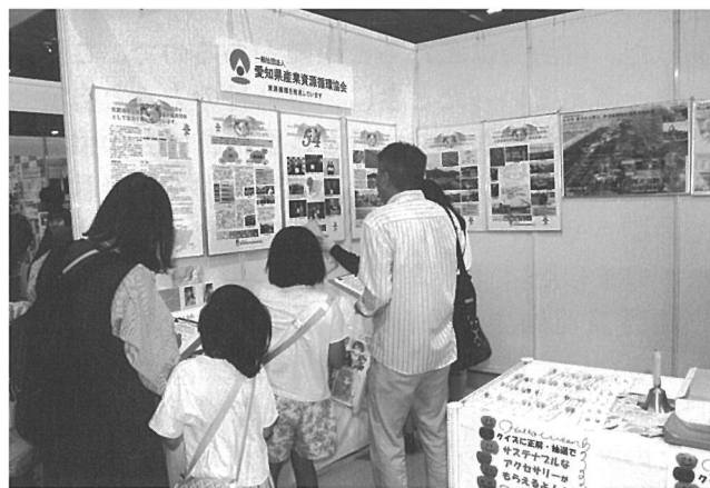
クイズの答えを求め展示パネルを見る来場者