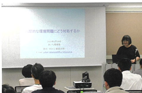
著名な講師による講義

卒塾生は、塾で学んだ知識や経験を生かし、それぞれの職場や地域での環境活動に取り組んでいます。また、塾生同士、アドバイザー講師、卒塾生、講師とのネットワークを卒塾後の活動に生かすことができます。2014年度からは、卒塾生等が中心となりNPO法人AKJ環境総合研究所を設立し、活動しています。