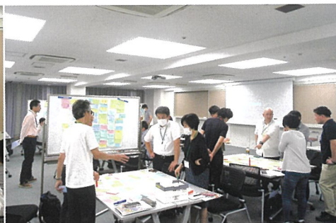
チームディスカッション