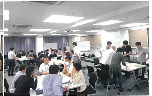
チーム分け後のディスカッション