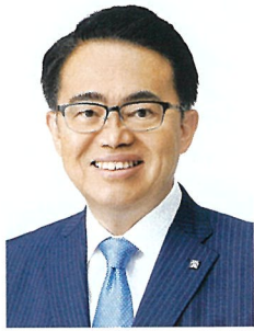
愛知県知事 大村 秀章

世界の資源・エネルギー需要や廃棄物は増加を続け、気候変動や生物多様性の低下など、地球環境問題も一層深刻となっています。2030年に向けて持続可能な社会を指向するSDGsが社会に浸透し、カーボンニュートラル、サーキュラーエコノミー、ネイチャーポジティブといった新たな概念が国際社会で共有されるなど、世界は大きく転換しつつあります。こうした世界の潮流の中で、愛知県においても環境と産業、暮らしの調和した持続可能な社会に向けて、産官学民が一丸となって、新たな社会の仕組みを創り出していかなければなりません。