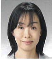
愛知県副知事 牧野 利香