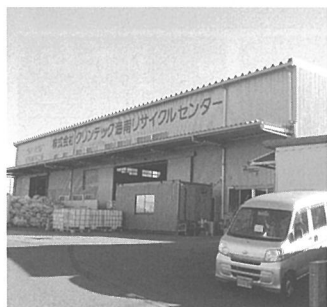
海南リサイクルセンター