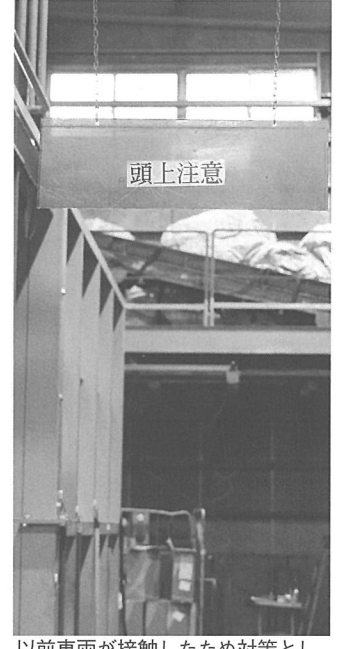
以前車両が接触したため対策として「頭上注意」を掲示