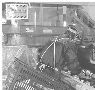
左上レーンにはビニールシートと巻き込まれ注意ポスター