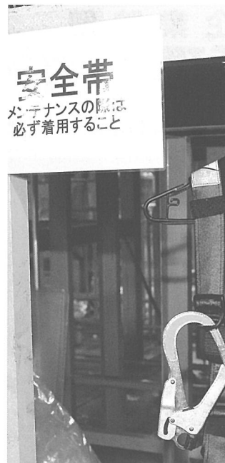
プラント内に掲示