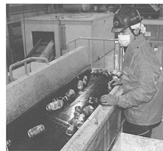
柵に囲まれた高所での作業現場