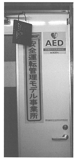
安全運転管理モデル事業所の指定を受ける