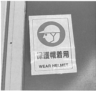
プラント入口に掲示