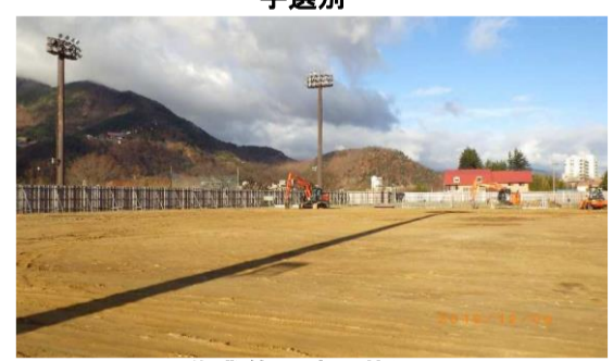
作業終了時の状況

支援結果 支援期間：令和元年11月13日から 令和2年3月27日まで 仮置場業務：22社 (延べ237名) 運搬業務：43社 (ダンプ162台) 処分業務：26社 総処理量：約1,886トン (仮置場鋤取り土砂を含む。) 協会正会員支援者：44社