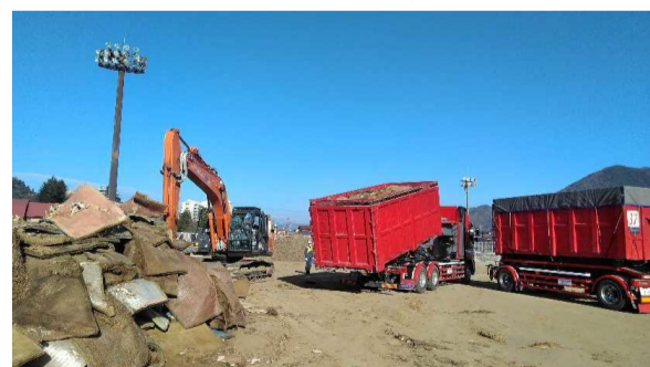
運搬車両への積込み