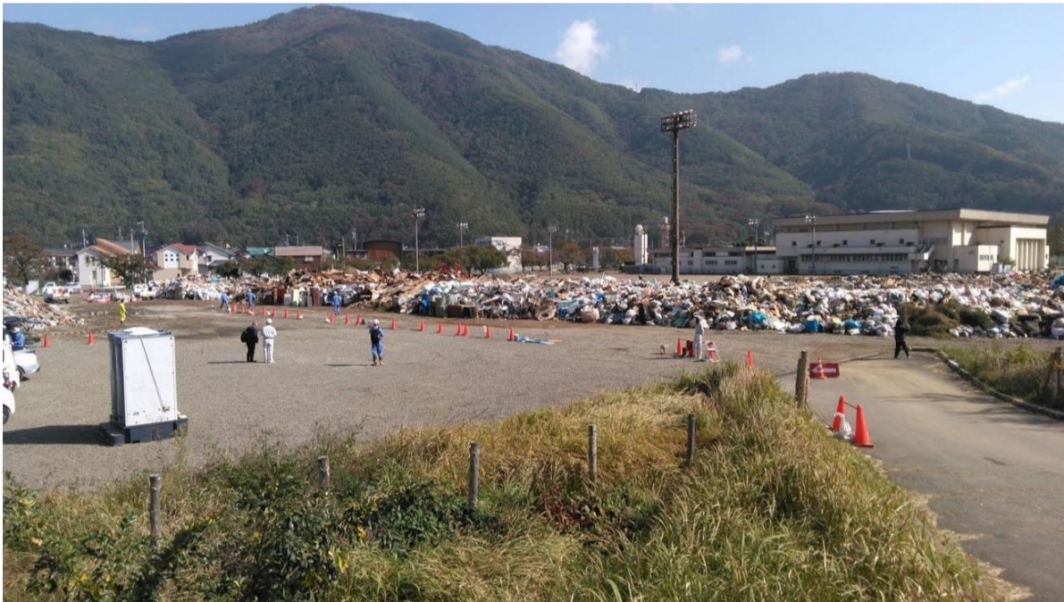
仮置場 (戸倉ABランド)