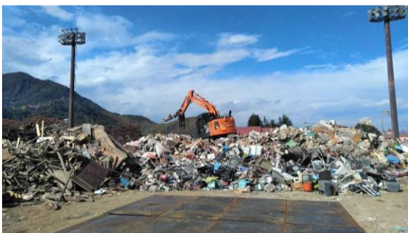
重機による破碎・選別