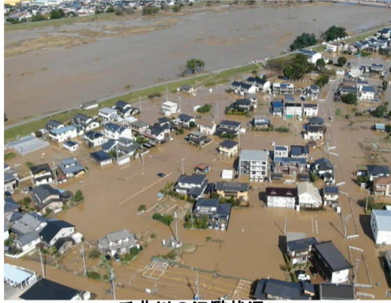
千曲川の氾濫状況