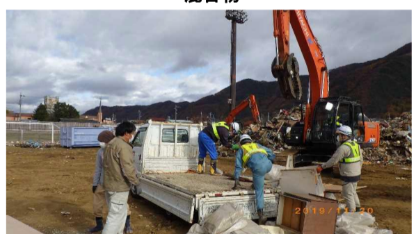
市民持ち込み対応