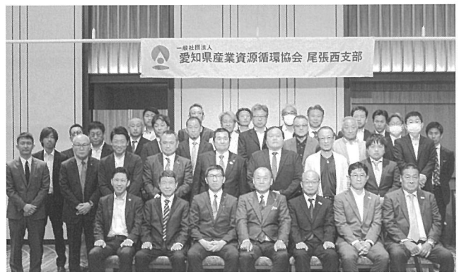
総会終了後の記念写真

親睦・交流を図る事業を開催します。具体的にはゴルフコンペ・支部ボウリング大会・支部を6ブロックに分けた地区ごとに開催する情報交換交流会等。新型コロナウイルスの感染状況を踏まえながら懇親会等も開催してまいります。