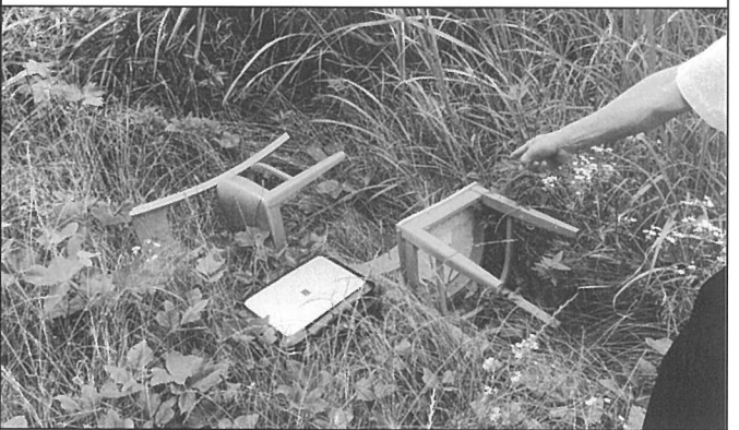
清須市春日土丑付近に椅子・プリンタが不法投棄