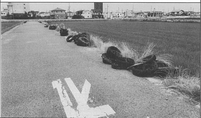
北名古屋市中之郷池田付近の農道脇に大量の廃タイヤが不法投棄