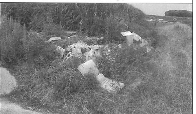
津島市下切町中割地区の道路脇に家電・家庭ごみが不法投棄