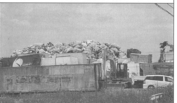
あま市丹羽にフレコン入りの廃棄物が山積みになっている