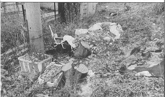
清須市桃栄、堀江ポンプ場付近に物干し、アルミ缶等が不法投棄