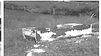
家庭ごみ等(昨年のまま)