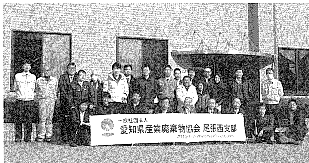
丸硝（株）社屋前にて

工程内に搬入され、ペットボトル・空き缶やビニール袋など大きな異物を手選別にて取り除き、粉碎機・除鉄機・振動ふるいで異物を