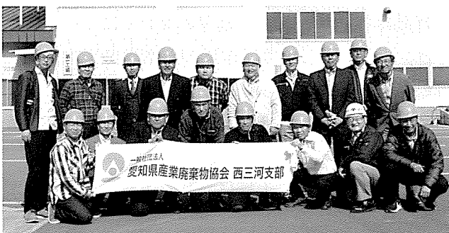
野村興産（株）イトムカ鋳業所の前で

3日目は余市、小樽を周り北海道の歴史と民族性についての社会学習を行いました。バスは新千歳空港へ向かい中部国際空港への帰路につき、北海道の視察見学会を無事に終えました。