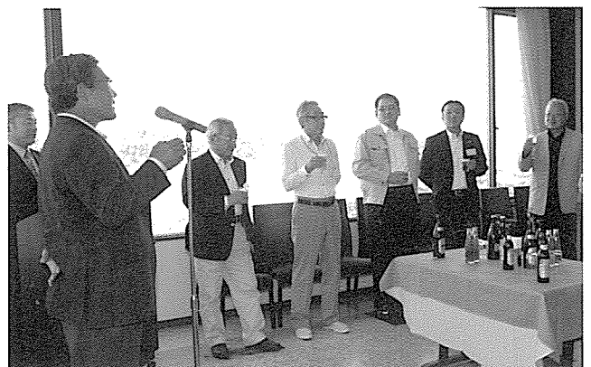
乾杯をする石川役員